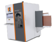
Evolution 7402 mit PinJet