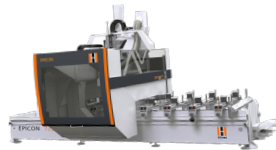
Epicon 7135 Bumper