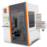
Evolution 7405 Connect