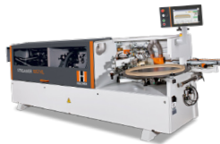
Streamer 1057 XL C